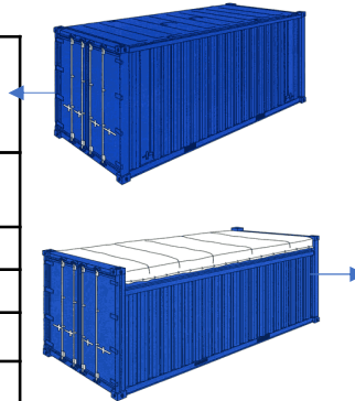
Contenedor 20 ´ OPEN TOP