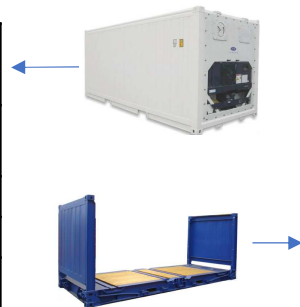
Contenedor 20 ´ FLAT RACK