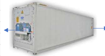
Contenedor REEFER 40 HIGH CUBE'