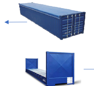
Contenedor 40' FLAT RACK